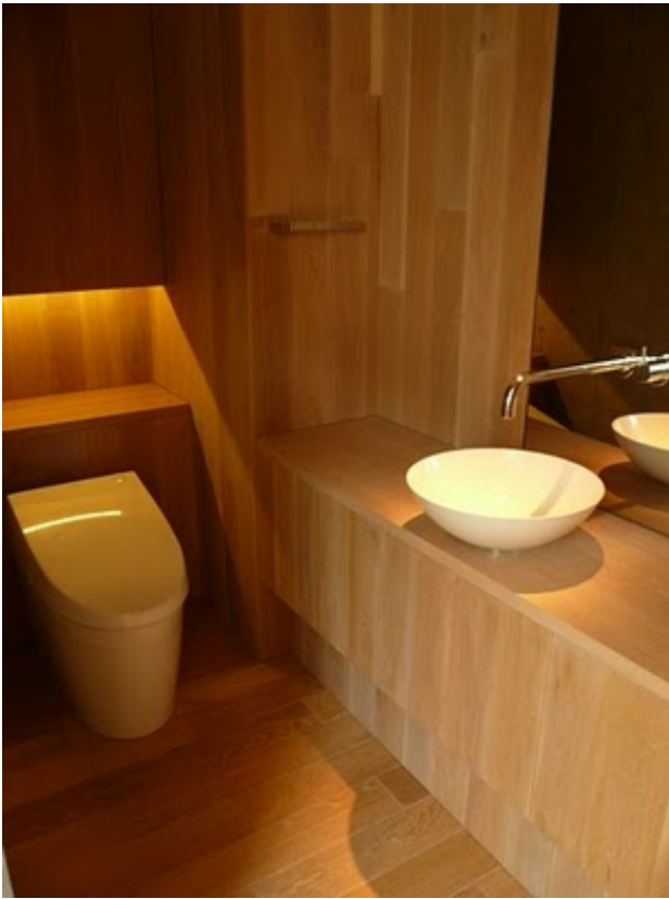
上がって左側にトイレ。