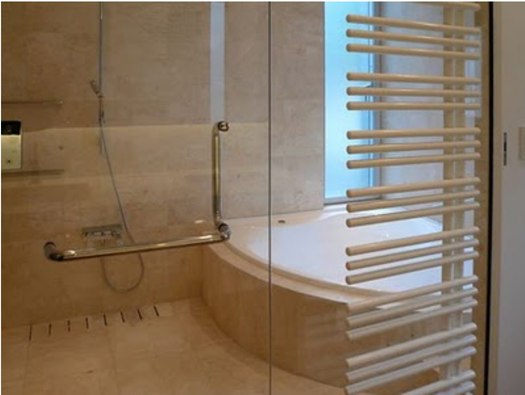
バスルームは大理石貼り。