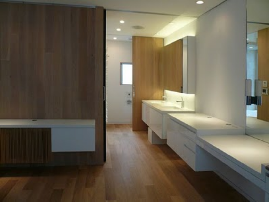
1階主寝室。奥が水回り。