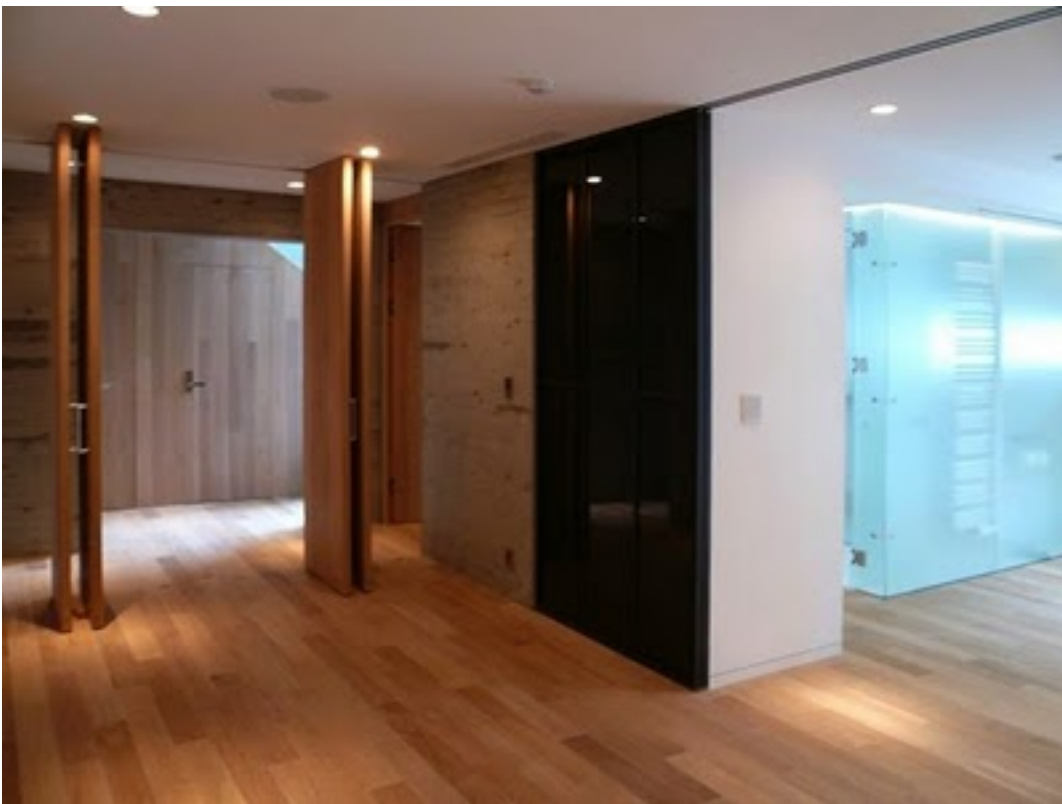
書齋奥から。右側がゲストルームで、書齋とは完全に仕切ることができます。右のガラス張りはバスルーム。