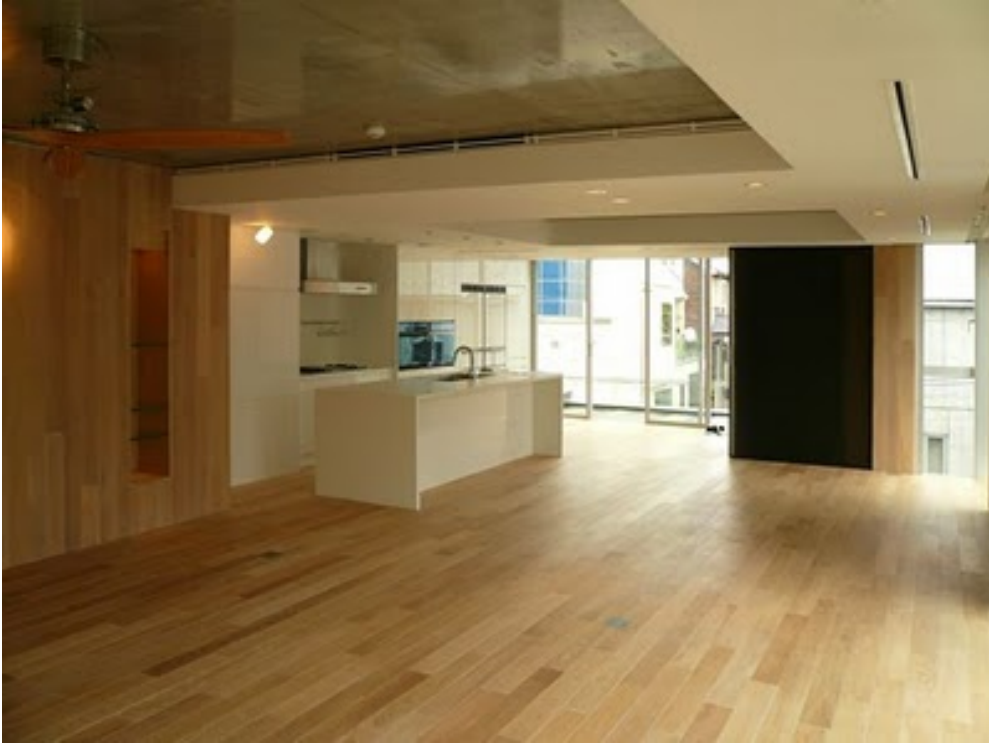
2階 LDK。この住宅で使われている木のほとんどはオーク材。 自然がもたらす木目や節が唯一の装飾といってもいいほど他はシンプルに統一したそうです。