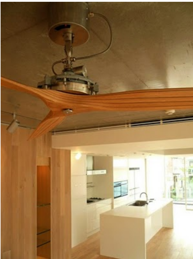
木目とメカが美しいイタリア製のファン。