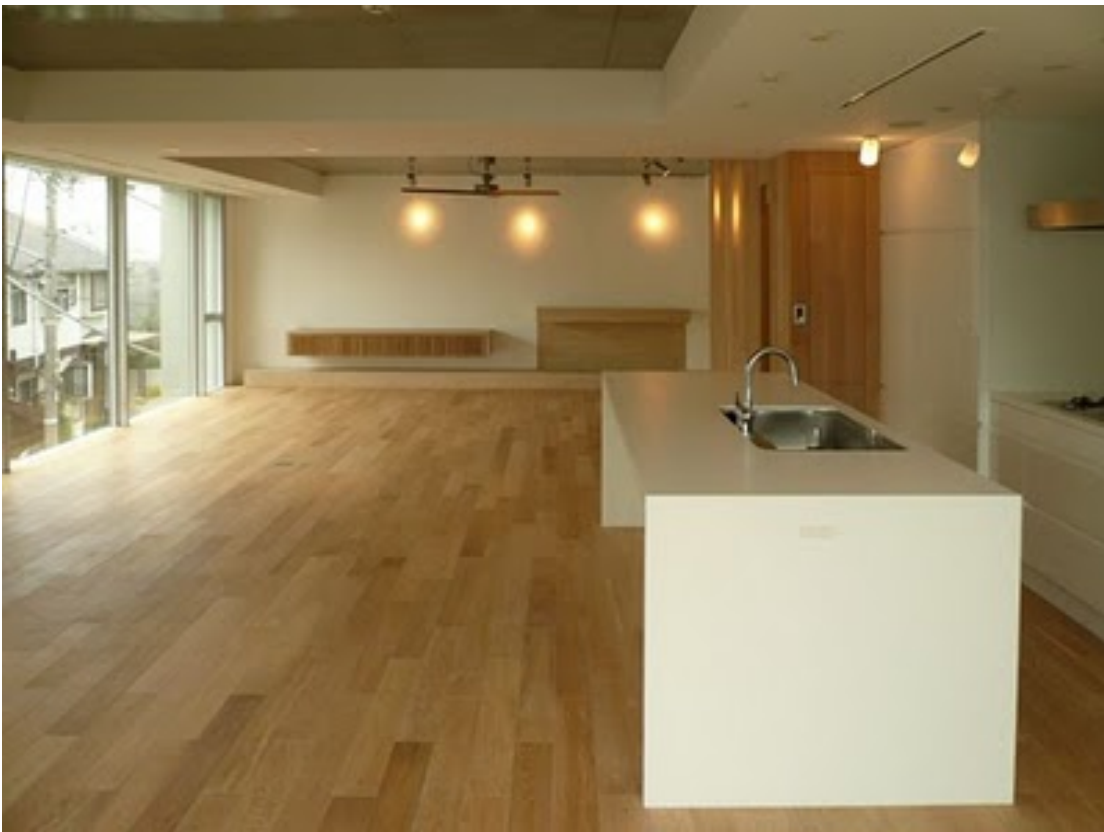
北東側から LDK を見る。アイランドキッチンはオールコーリアン製。