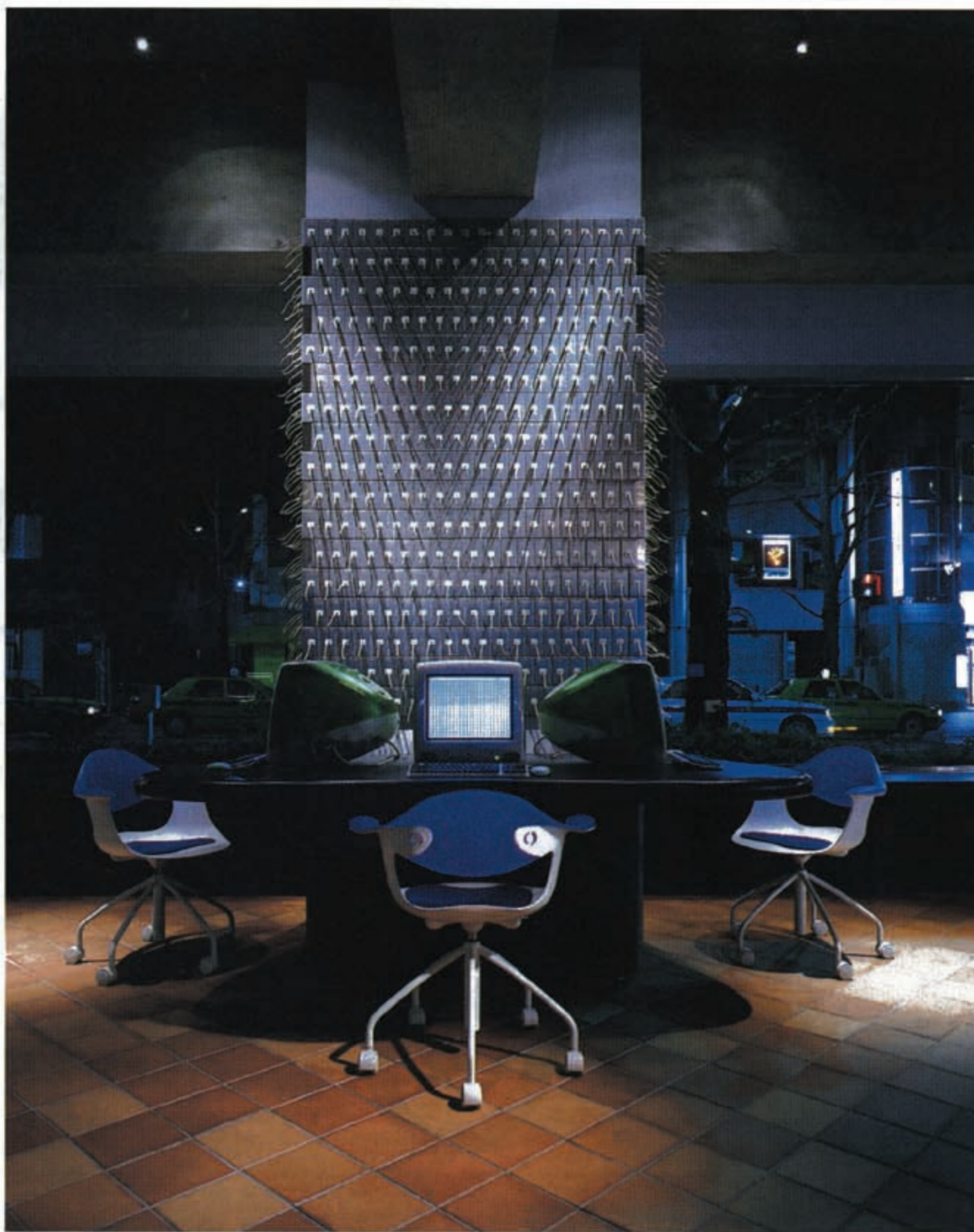
1階の情報端末付近。端子とケーブルで柱全面を埋め尽くしたデザインが特徴

「レオパレス」ブランドで賃貸アパートを全国展開するエムディアイは、4月15日、東京・新宿にコミュニケーションスペース「レオパレスワールド新宿」を開設した。このスペースは、賃貸住宅を探す人々に自社物件を紹介すると同時に、アパート経営を考えるオーナー層にレオパレスの特徴や同社の企業姿勢を伝えるためのもの。インターネット端末を使った情報検索で物件探しを行いできるだけペーパーレスにしたほか、モデルルームをライフスタイル別にディスプレイするなど、これまでの不動産紹介所にはない機能とイメージを空間に持ち込んだ点が特徴となっている。これらのプランニングとデザインは、イタリア人デザイナー、リカルド・トッサーニ氏が担当した。