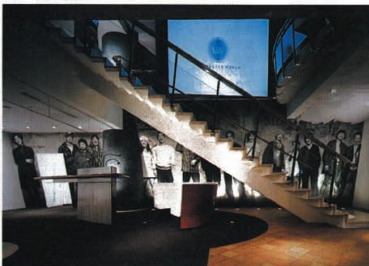
1階の階段周辺。レオパレスがターゲットとする若者層の写真を壁面に取り入れた

レオパレスワールド新宿 〒160-0023 東京都新宿区西新宿1-23-3 ☎03-5325-1211